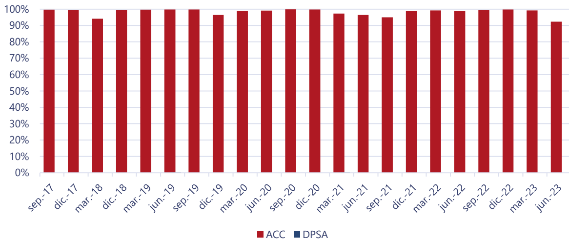
Ilustración 1: Distribución de cartera por tipo de instrumento