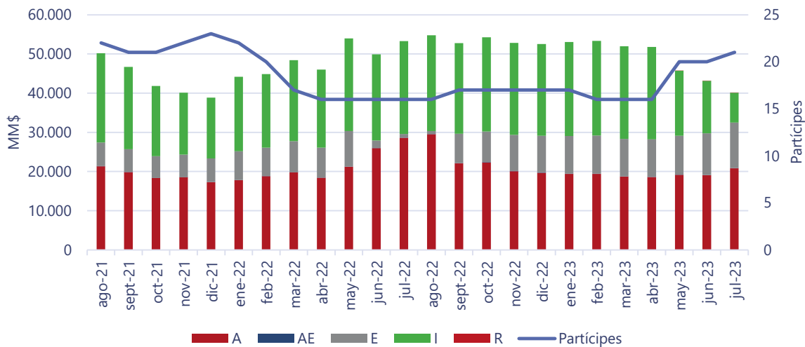
Ilustración 2: Evolución del patrimonio y partícipes por serie

Al cierre de julio de 2023, el fondo presentaba un tamaño de $ 40.096 millones, donde la serie A representa un 51,90% de éste. En los últimos dos años, el patrimonio del fondo ha promediado $ 48.521 millones, teniendo su peak en agosto de 2022. La Ilustración 2 presenta la evolución del patrimonio del fondo y sus respectivos partícipes.