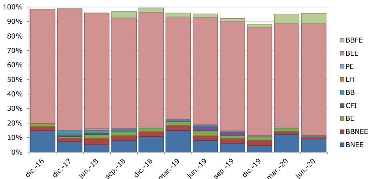
Ilustración 2: Composición de la cartera de inversión por instrumento 5

En relación a los principales emisores de la cartera de inversión que tiene MBI Deuda Latam FI destacan sociedades que pertenecen al sector de Materias Primas o Commodities , sin embargo, son porcentajes relativamente bajos lo que demuestra una correcta diversificación del portfolio de inversión. La Tabla 5 detalla los principales emisores que tiene el fondo.