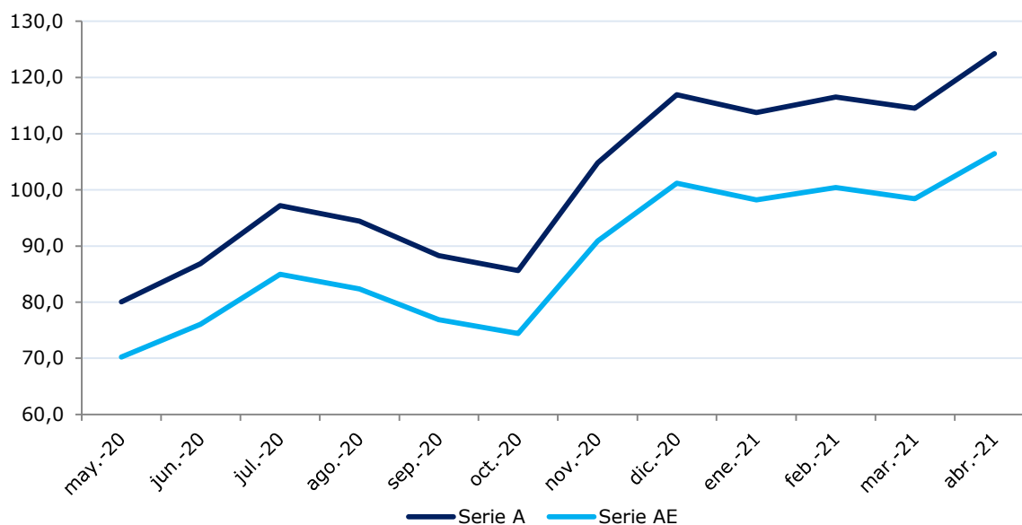
Ilustración 1: Evolución del valor cuota en base 100