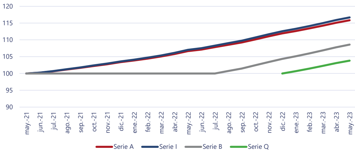
Ilustración 3: Evolución del valor cuota en base 100

FI Sartor Táctico inició sus operaciones en septiembre de 2012 como fondo de inversión privado, sin embargo, en septiembre de 2016 pasó a ser un fondo de inversión público rescatable. Analizando la variación del valor cuota que considera el efecto de las remuneraciones, pero no considera reparto de dividendos, es posible observar que, en los últimos 24 meses, en promedio, la serie A varió un 0,61%, la serie I un 0,64%, la serie B un 0,35% y, por su parte, la serie Q varió 0,82% con respecto al mes anterior. La variación del valor cuota en los últimos años puede observarse en la Ilustración 3. Adicionalmente, la Tabla 3 presenta las variaciones del valor cuota para cada serie.