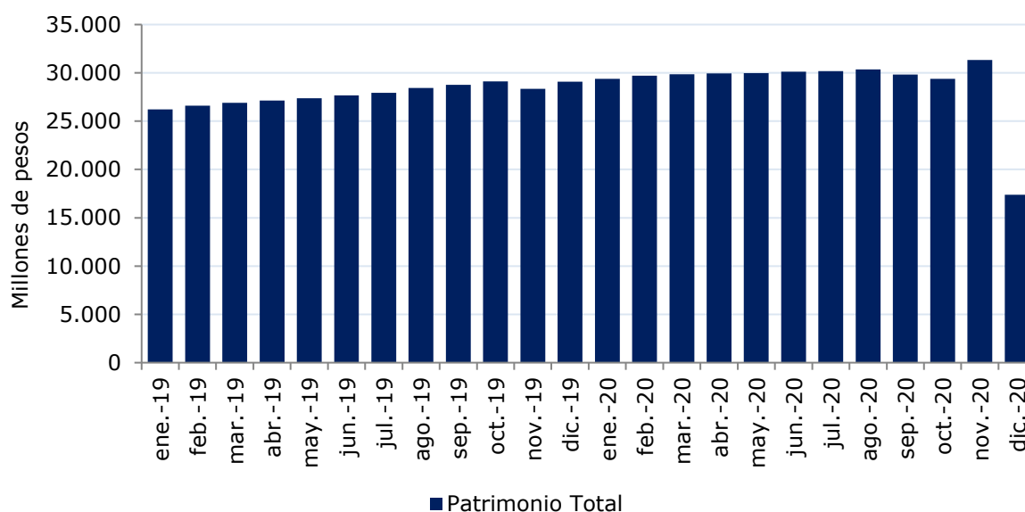
Ilustración 3: Evolución del patrimonio del fondo

A diciembre de 2020, Infraestructura FI presentaba un tamaño de $17.378 millones, patrimonio significativamente menor al que administraba, en promedio, en los últimos dos años lo cual se produce a partir de una disminución de capital por una cantidad total de 892.885 cuotas suscritas y pagadas. En los últimos dos años, el fondo alcanzó un patrimonio promedio de $28.376 millones, presentando su peak en noviembre de 2020. La evolución del patrimonio del fondo en los últimos dos años se puede apreciar en la Ilustración 3.